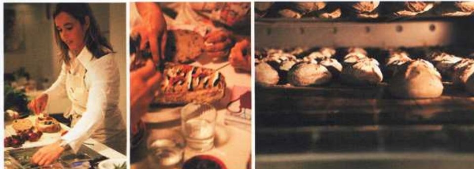
Van linksaf: twee keer een gevuld campagnebrood in aanmaak, rechts de rijzende broden.