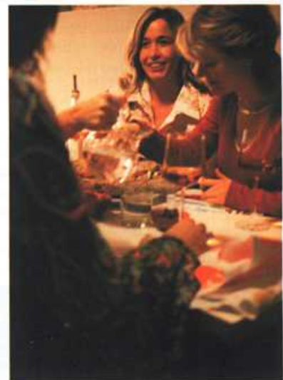
Lunch met campagnebrood.