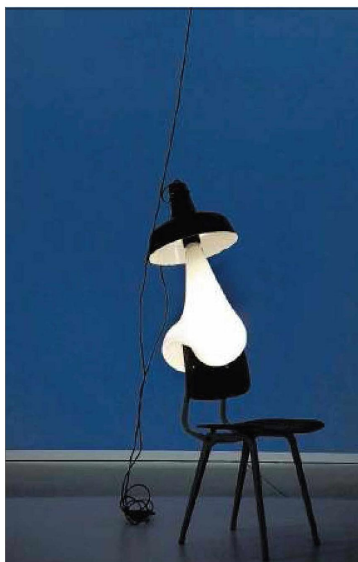
Light Bulbs van Pieke Bergmans